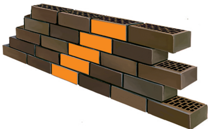
3 ЛОЖКОВАЯ КЛАДКА КОСОЕ СМЕЩЕНИЕ НА 1/4