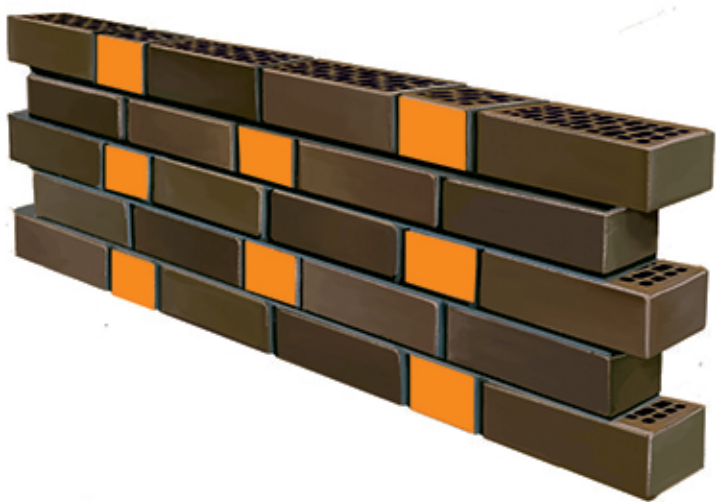
1 ЦЕПНАЯ КЛАДКА